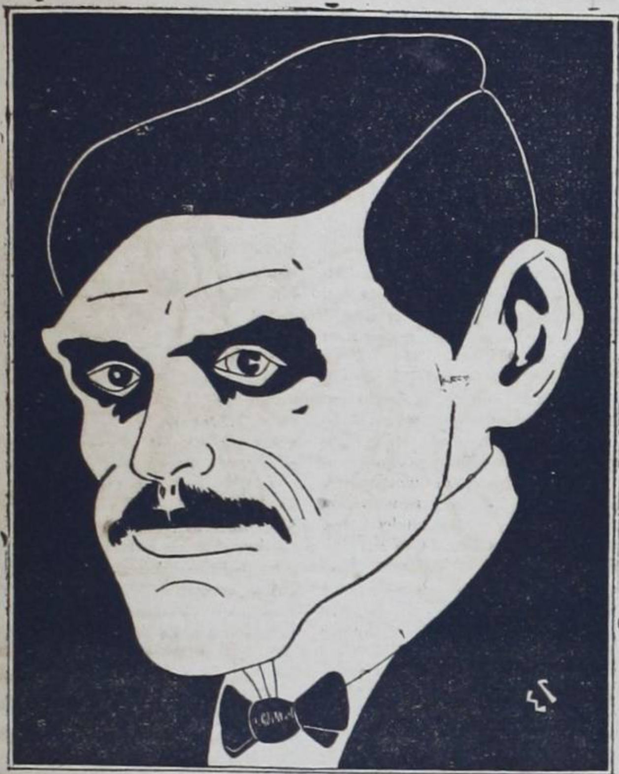
Este es un sabio perfecto, que honra la Pedagogía, pues nunca ha sido defecto tener la testa vacía.